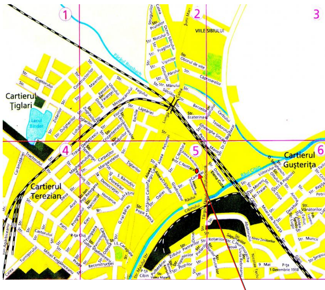
Poziționarea colegiului pe harta Sibiului

Această unitate de învățământ – care se dorește cu valențe europene, în contextul devenirii Sibiului capitală culturală europeană în anul 2007, dar și în perspectiva integrării României în Uniunea Europeană, pregătește personal calificat în diferite ramuri ale industriei alimentare, industrie cu tradiție și binemeritate aprecieri, interne și internaționale.